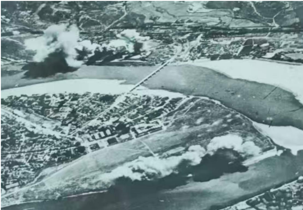
抗日战争期间的韶城及曲江旧桥